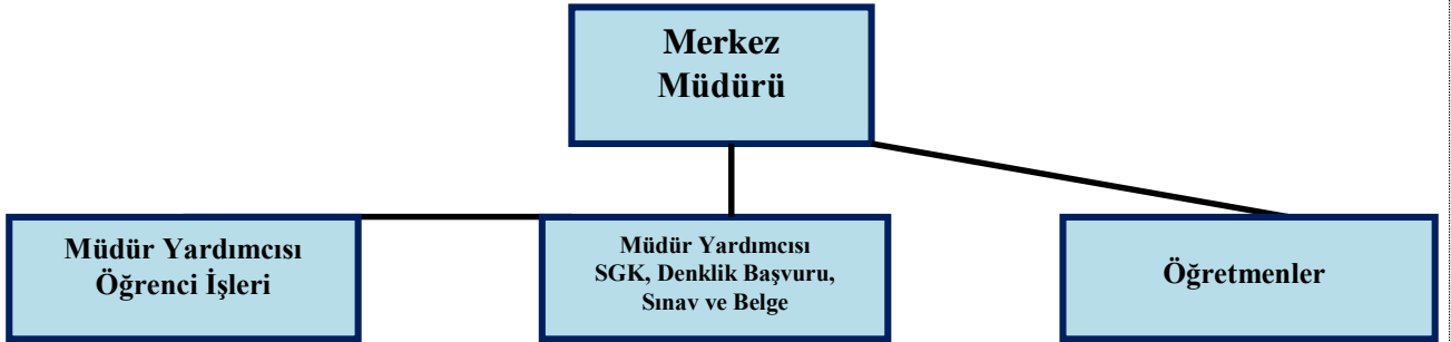
Şekil 2: Elazığ Adalet Mesleki Eğitim Merkezi Müdürlüğü Örgütsel Yapısı